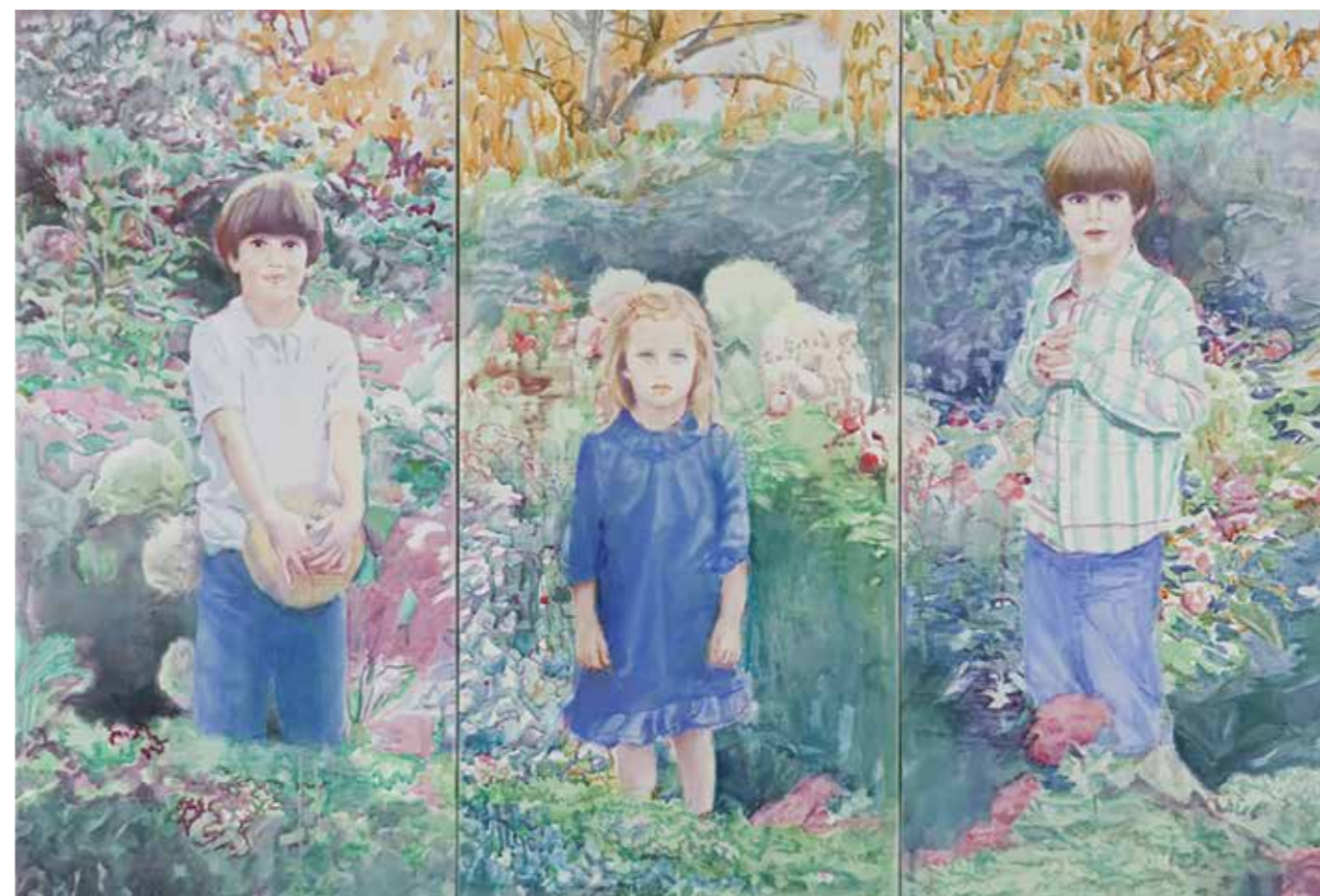
«3 enfants dans un jardin», Oil on canvas, 98x144 cm, 2010