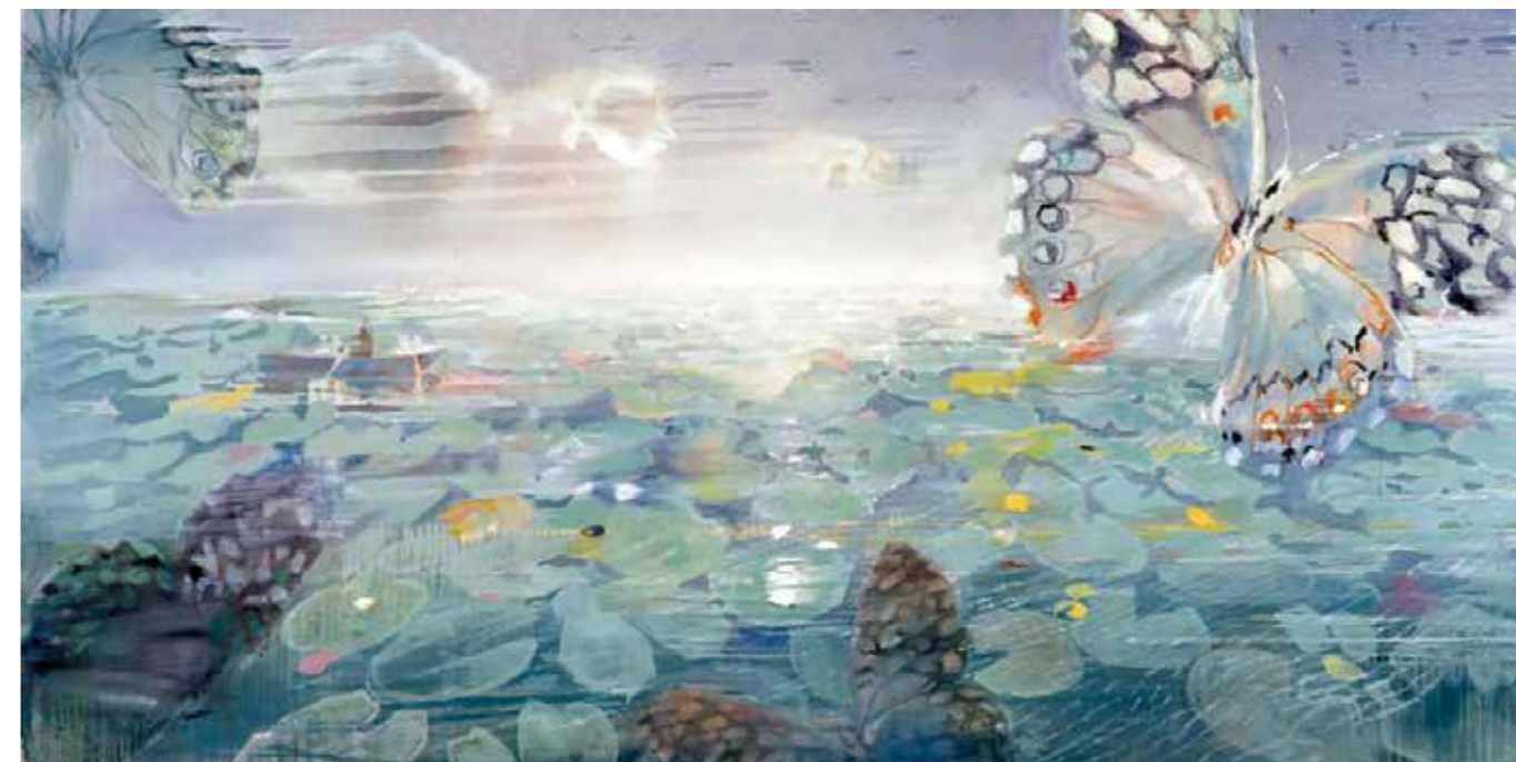
«Lumière d' Horizon», Oil on canvas, 97x195 cm, 2008

Το μόνο που μπορώ να σας απαντήσω σε αυτή την ερώτηση είναι ότι από μικρή αυτό ξέρω να κάνω και ότι έτσι μόνο αισθάνομαι απόλυτη ελευθερία. Η πάλη με το υλικό και το ταξίδι που κάνεις, όταν αρχίζεις ένα έργο, σου δίνει την αίσθηση ότι όλα είναι δυνατά.