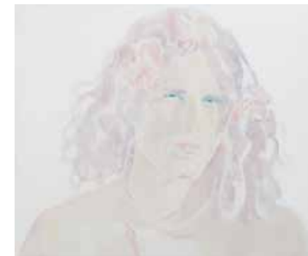
Untitled, Oil on canvas, 82x66 cm 2016

For an artist coming from a scenography background like myself, these were truly important steps.