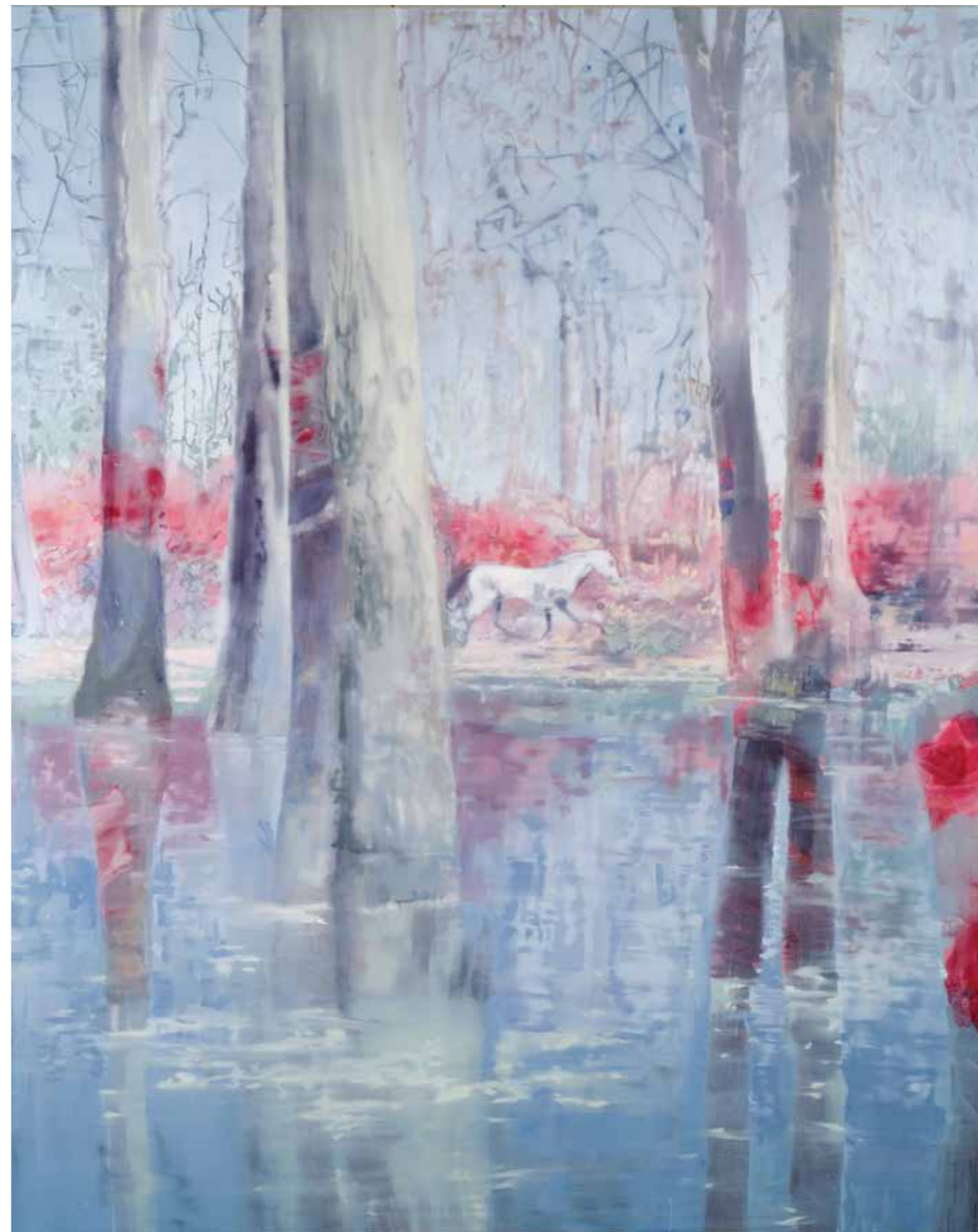
«Le petit cheval rouge», Oil on canvas, 210x166cm, 2011

«Art is all I know to do, since I was young. Only then do I feel completely free».