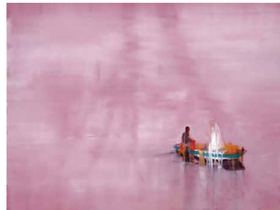
«Remember ths world you're watching», Oil on canvas, 95x120 cm, 2009