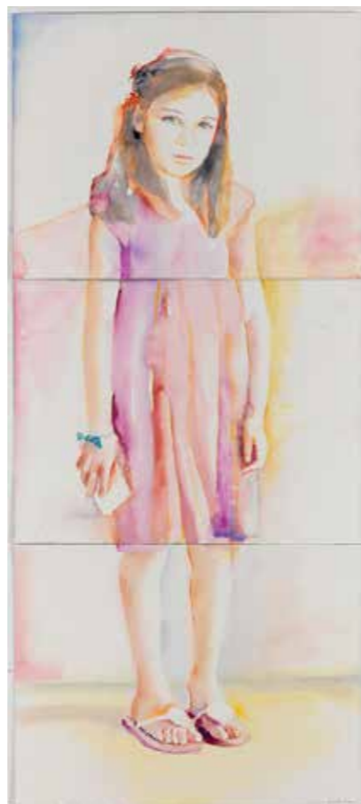
«Dana», Watercolour on paper

Όταν ζεις τη ζωή σου, σου φαίνονται όλα φυσικά. Η ζωή σου ρέει, όπως είναι χαραγμένος ο δρόμος σου, έχοντας πάντα κατά νου τους στόχους σου, συνειδητά ή υποσυνείδητα. Ένα πράγμα που δεν παραβλέπεται πότε είναι η αγάπη. Και όταν την έχεις γύρω σου προχωράς με τα μάτια κλειστά!